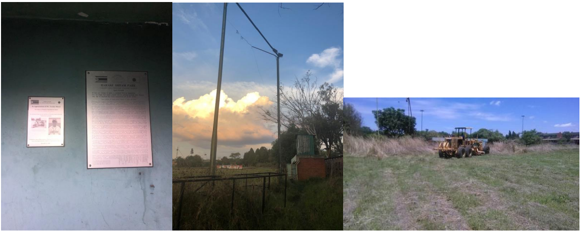
今は使えない「ハラレドリームパーク」跡地。(左)1 塁側ダッグアウト内の記念プレート (中)バックネットと1 塁側ダッグアウト、(右)再整地中とのことだが・・・