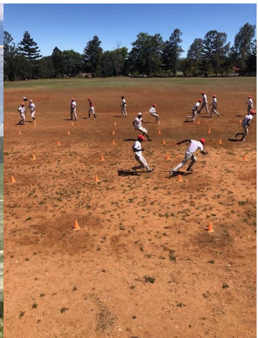
昨年 12 月のドリームカップと代表合宿、ジャカラダの並木(右上)